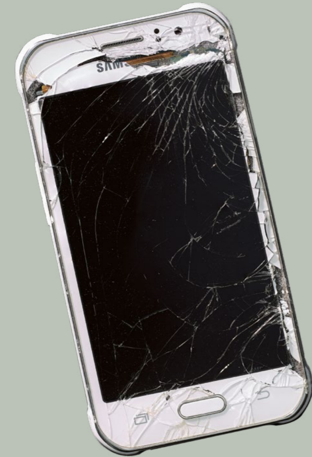
Auf der Flucht mitgeführtes Mobiltelefon von Mohammed Ebrahimi, um 2014

Europe and the Sea reveals just how fundamentally the sea has shaped the development of Europe, exploring the roles it has played and continues to play. The exhibition covers the centuries from the Age of Antiquity to the present. It examines the sea's significance as a facilitator of European expansionism and trade, as a bridge and barrier, as a resource, and as a focus of yearning and imagination. In addition to the historical dimension, it casts a spotlight on many aspects that are of ever greater importance to us today. In view of the millions of refugees crossing to Europe, the role of the sea as a bridge and barrier to the continent has acquired new relevance. Environmental concerns, climate-related issues, and the use or overuse of marine resources are also subjects of growing public debate.