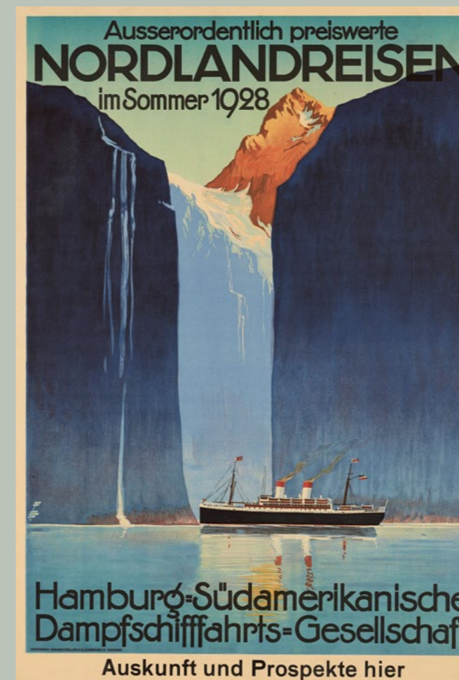
Werbeplakat der »Hamburg-Südamerikanischen Dampfschiffahrts-Gesellschaft« für »Ausserordentlich preiswerte Nordlandreisen im Sommer 1928«, 1928