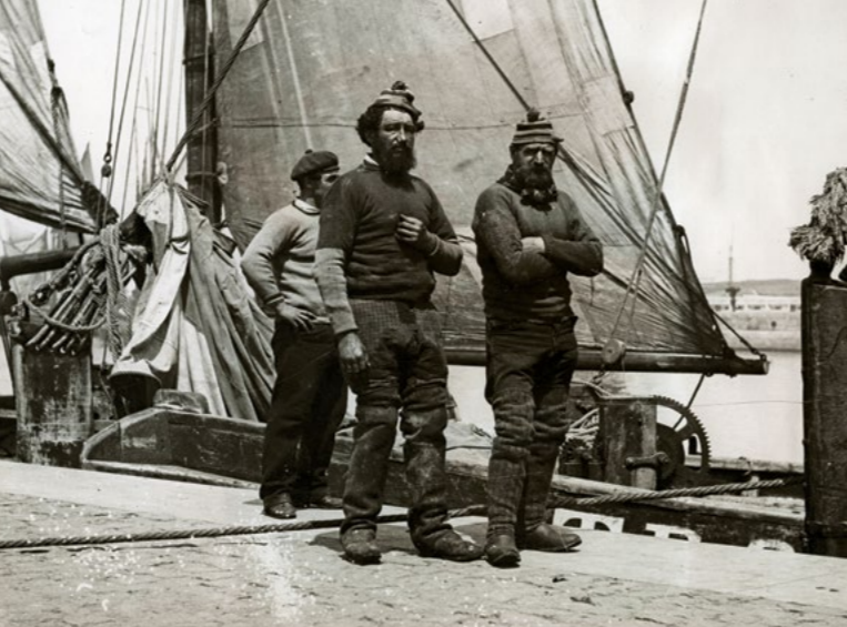
Seelente am Kai vor einem Segelschiff, um 1900, © Deutsches Historisches Museum, Berlin

The exhibition addresses many different senses and invites visitors to see, hear and touch objects at different stations. The design is largely barrier-free. All exhibition texts are in German and English. The main texts are also available for blind and visually impaired people in German Braille and large print in black-on-white as well as white-on-black, and in Easy Language for people with learning difficulties, as well as in German Sign Language for deaf people. These offers are correspondingly indicated in the texts. The objects are displayed at different heights, and most showcases are accessible to wheelchairs. The high contrast of the colours makes them easier to see.